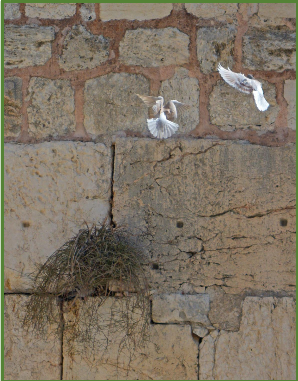
Klagemauer mit Friedenstauben

der Ev.-Luth. Kirchgemeinde Seelingstädt-Blankenhain-Rußdorf Oktober und November 2024